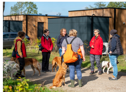
oben: Teamfoto 2025, unten: Dummytraining